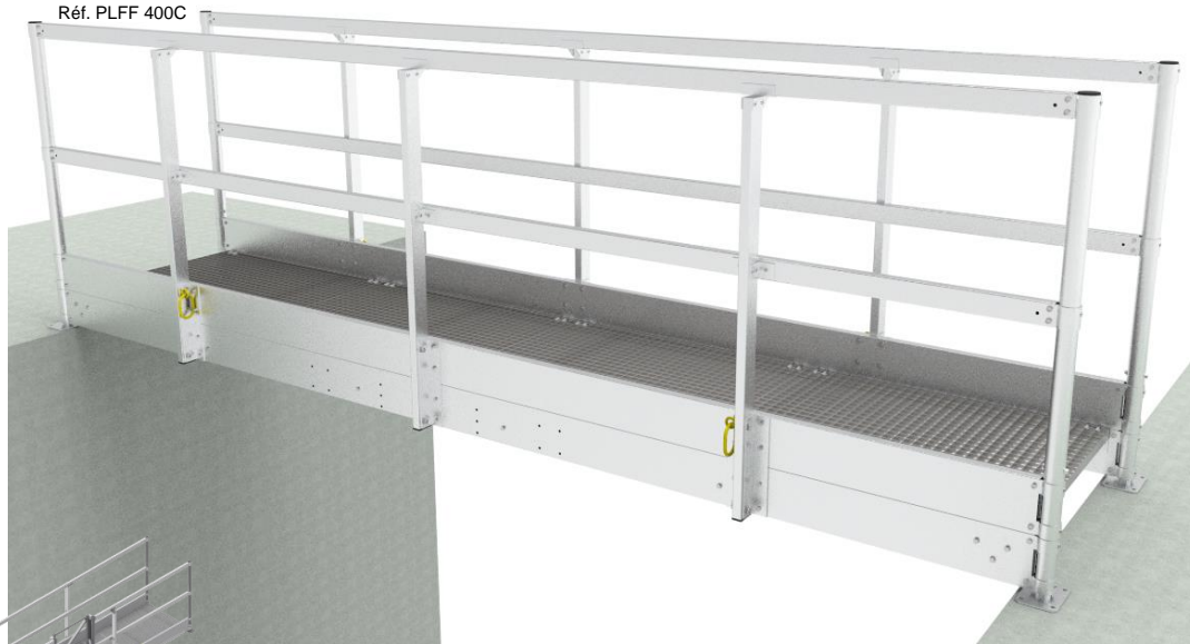
Réf. PLFF 400C

*Réglage des pieds sur 150mm (lors de la pose)