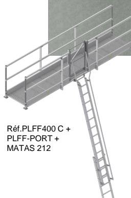
Réf. PLFF400 C + PLFF-PORT + MATAS 212

Option Portillon pour sortie latérale Réf. PLFF-PORT Poids : 9 kg