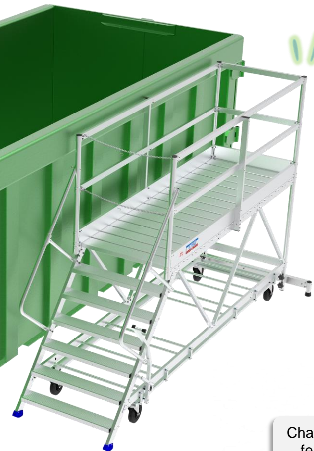
Plate-forme en aluminium pour accès bennes à déchets