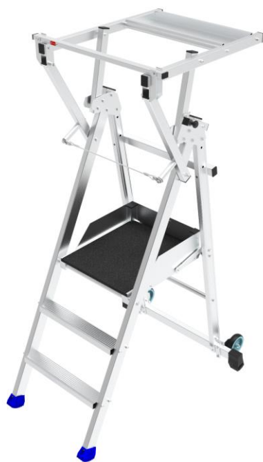
Plate-forme individuelle pliante aluminium avec porte outil intégré Hauteur de travail maxi : 4,25 m

Conforme au décret 2004-924, norme EN 131-7 et norme NF P 93353 jusqu'à 1,50 m plancher. Conforme au décret 2004-924 à partir de 1,75 m plancher.