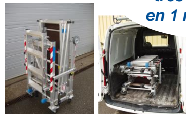
Stockage et transport aisés

“ Le NORMAPLI est un produit MDS (Montage et démontage en sécurité). Grâce à son système de garde-corps intégrés au plateau, le NORMAPLI R ne peut être monté et utilisé qu'en sécurité. ”