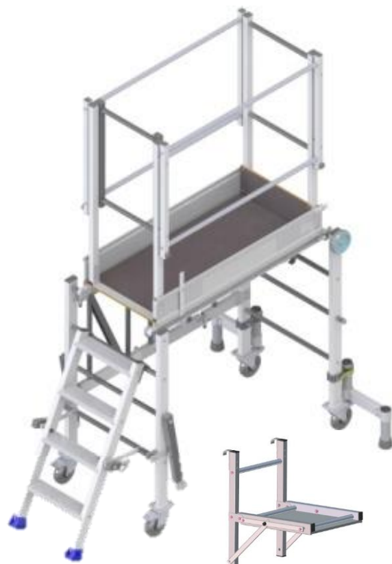
Option porte-outils Réf. NMP PO