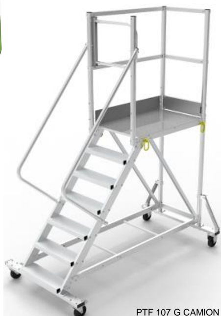
PTF 107 G CAMION