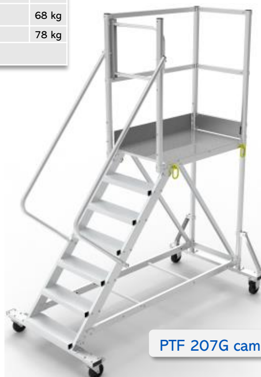
PTF 207G camion

Option : Kit de roues escamotables par levier centralisé Réf : KRE 107 Réf : KRE 207