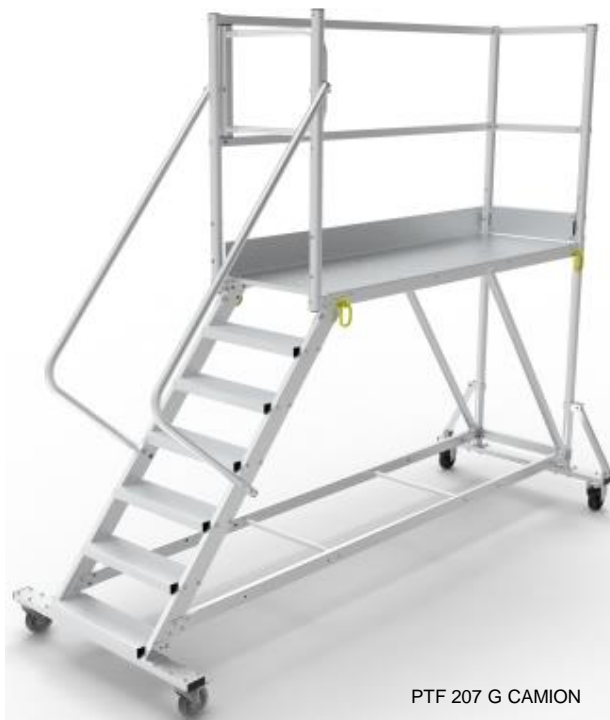
PTF 207 G CAMION